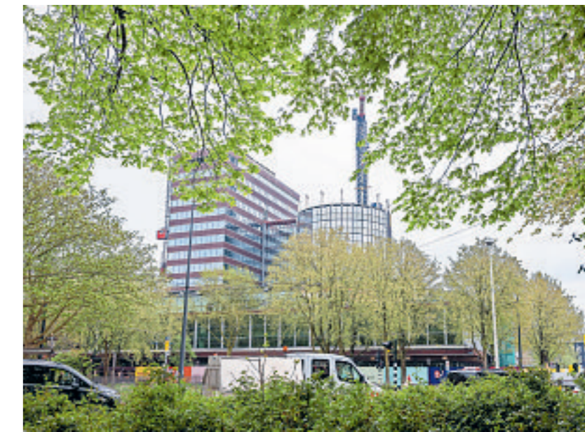
Foto boven Laag voor laag verdwijnt de 'Satelliet' van architect Abma uit 1990. De modulair gebouwde toren wordt elders in Amsterdam hergebruikt. Links De zogenoemde Kashal van DNB, waar vroeger het geld werd geteld. Bevrijd uit een kluwen van systeemwandjes en beveiligingspoorten blijkt het een imposante ruimte. Onder Een van de twee betonnen 'wikkeltappen' van Duintjer. Er komen er nog twee extra bij, tijdens de renovatie.

Maar deze totem gaat zich wel aanpassen aan de veranderende stad eromheen. Dat Duintjer op de zonnige zuidkant van het gebouw, aan het water van de Singelgracht, een 'opstelplaats voor auto's' plan-de, lijkt nu onbegrijpelijk. Destijds was de wijk aan de overkant van het water, De